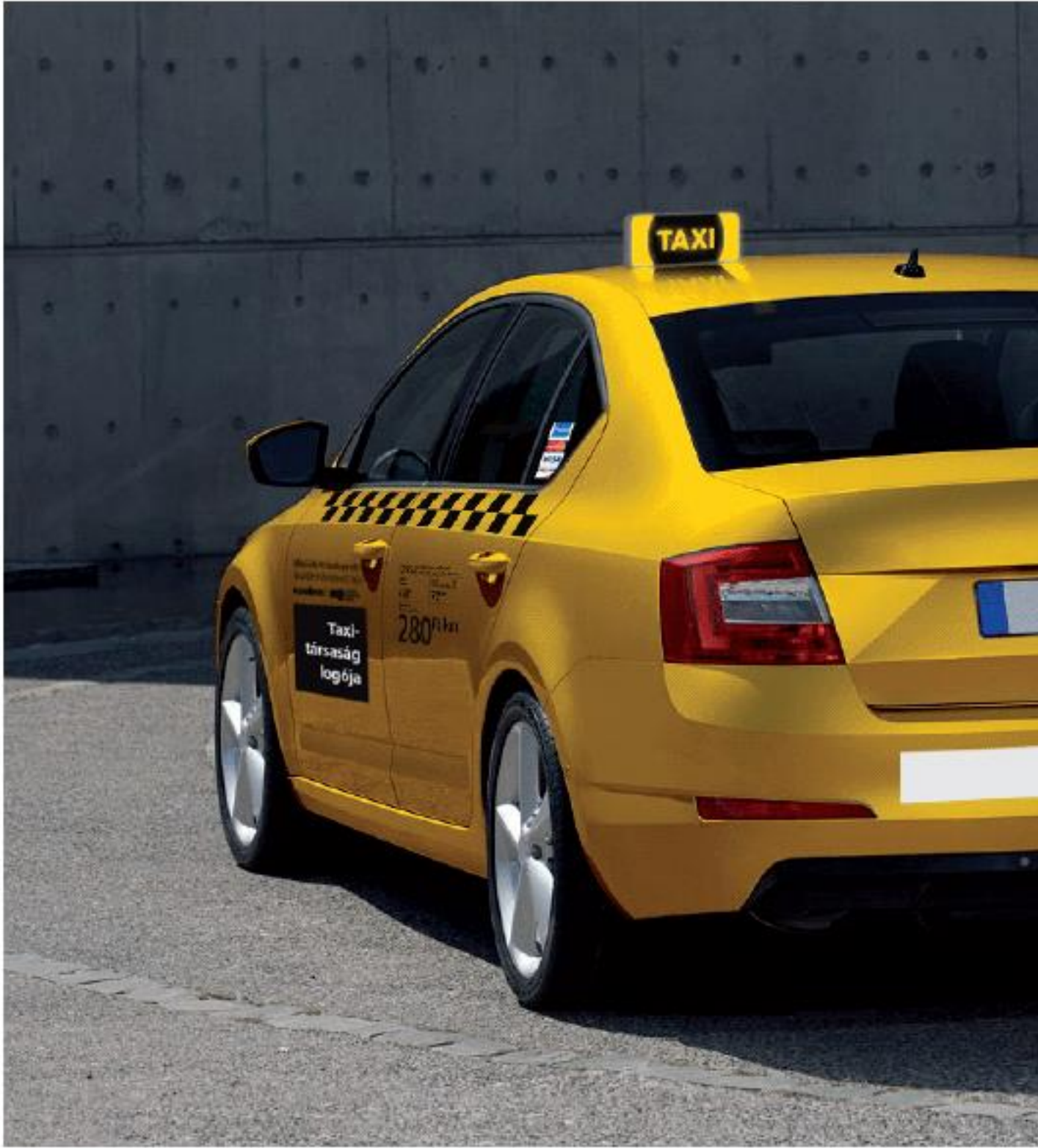
3. melléklet a 31/2013. (IV. 18.) Főv. Kgy. rendelethez